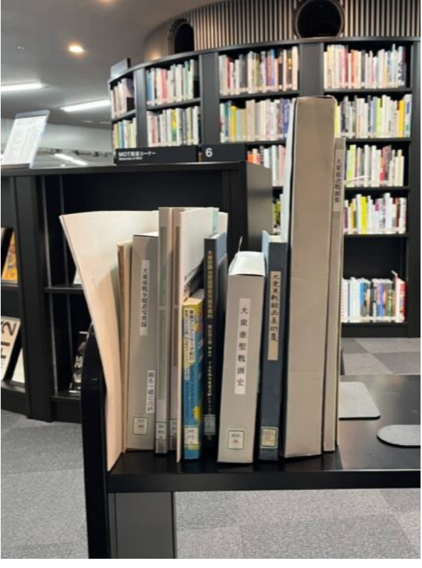
熱帯の書棚 - Dot in Japan